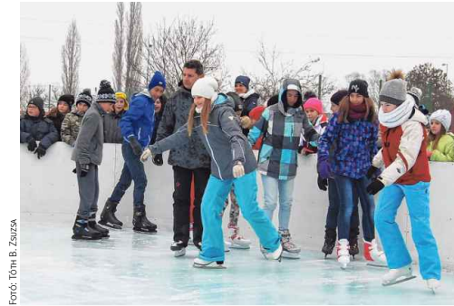
A badacsonytomaji iskola ajándék jégpályáját elsőként a hatodik osztályosok vették birtokba

A Balaton-parti településen a Kölcsény-szobor koszorúzásával értek véget a magyar kultúra napi programok. Az ünnepség egyperces néma