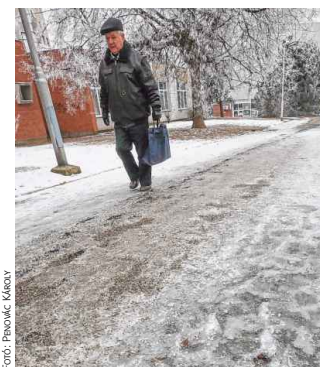
A Cholnoky-lakótelep központjában is csúsznak a járdák

ságmentesítés során konyhasó (nátrium-klorid-tartalmú szerek) használata tilos, elhelyezett homokot, darált salakot, hamut, futorgácsot, zeolitot, kőzúzalékot vagy egyéb környezetkárosító anyagot lehet erre a célra használni. A szabályozás szerint a járdák felszórására homló szerves anyag, vagy a burkolatra káros anyag szintén nem alkalmazható. Amennyiben az ingatlan tulajdonos nem tesz eleget a rendelkezés előtti kötelezettségnek, a polgármester hatósági határozatban kötelezheti erre a szabályszerűt.